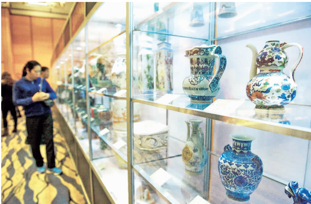
1月4日，澳门艺术博览会在澳门旅游塔举行开幕仪式，展出玉器玉石、书画、青铜器等逾600件珍品。图为观众在澳门艺术博览会上参观。