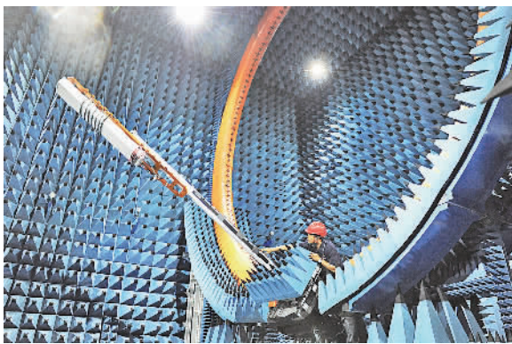
先进的大型无线测试场运行平稳。