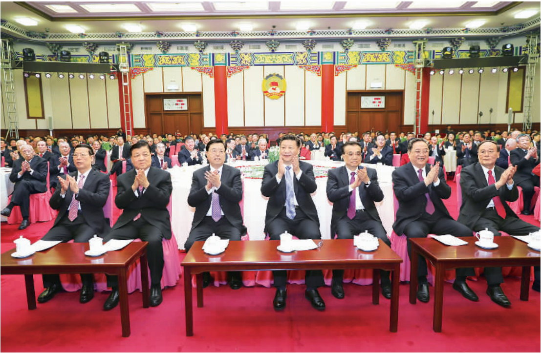
12月30日,全国政协在北京举行新年茶话会。党和国家领导人习近平、李克强、张德江、俞正声、刘云山、王岐山、张高丽出席茶话会并观看演出。