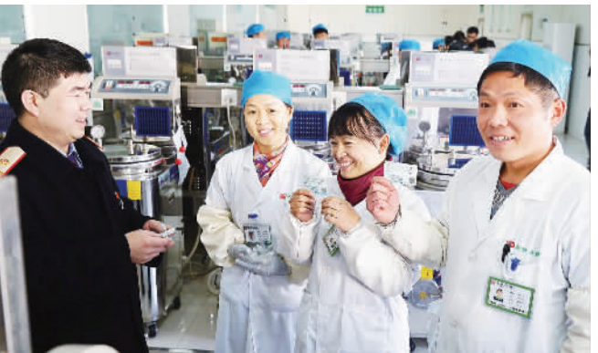
12月22日,北京西站工作人员将火车票送到北京本草方源药业有限公司员工手上。春运在即,为方便外地务工人员返乡,北京西站为购票较为集中的企业送票上门。