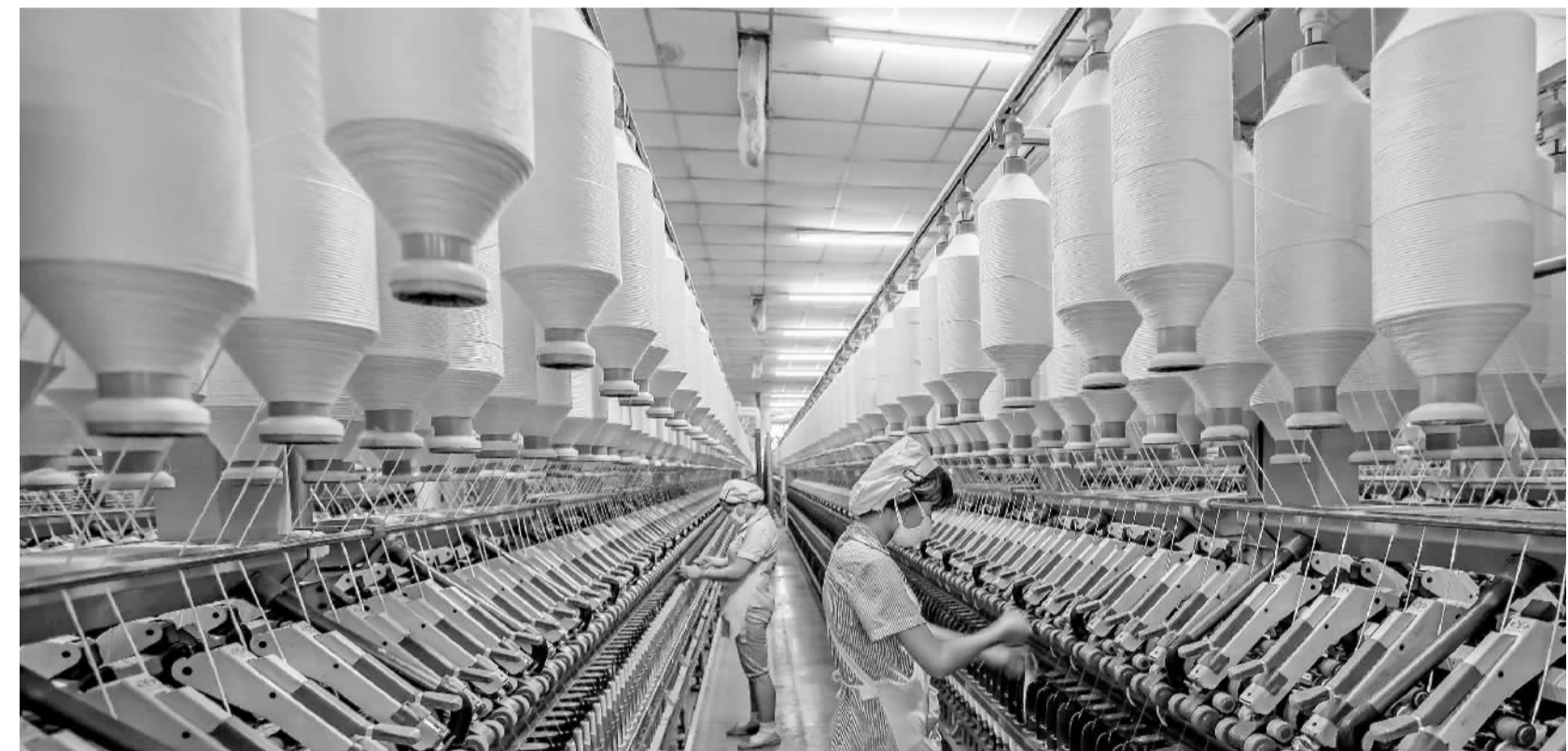
12月17日,江苏海安县联发棉纺有限公司员工正在生产。海安县是全国纺织产业基地县。近年来,当地通过政府服务企业科技行,促进企业转型升级,与高校、供应商、科研机构等开展形式多样的产学研合作,同时把引进的纺织项目向园区集聚,形成纺织板块,催生集群效应。今年前11月,海安县纺织产业实现销售超百亿元。

易地扶贫搬迁成为凉山脱贫攻坚的“当头炮”。在西昌市书夫村易地搬迁集中安置点,丰子跑总算搬进了期盼已久的新家。丰子跑说,能搬到交通便利的山下居住,是他和家人多年