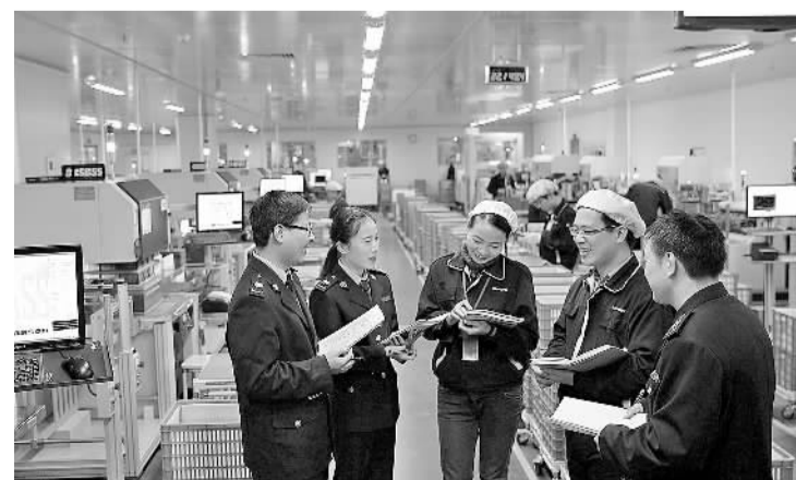
日前,江西吉安市吉水县国税局税务干部深入到江西景旺(吉水)精密电路有限公司宣传税收知识。该局按照“风险预防控制与管理并存,专业化管理与纳税遵从双向互动”工作思路,对企业开展风险防控指导,帮助企业防范和化解涉税风险。

目前,河南省国税局正以便捷办税、专业服务、降低成本为工作核心,为纳税人提供优质办税环境。推行网上办税,网上申报面超9成,个体户网上缴税面超6成;推行“同城同办”和“国地税联动”;扩大自助办税覆盖范围,推行“掌上办税”,为纳税人提供从“足不出户”到“如影随形”的服务体验。