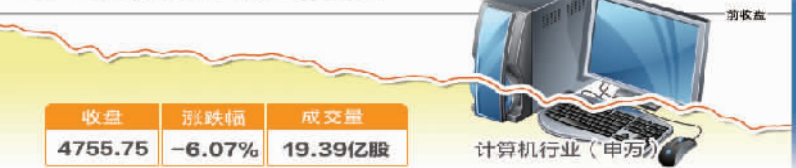
12月12日波动最大行业走势图