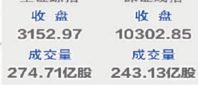
12月12日深证成指走势图