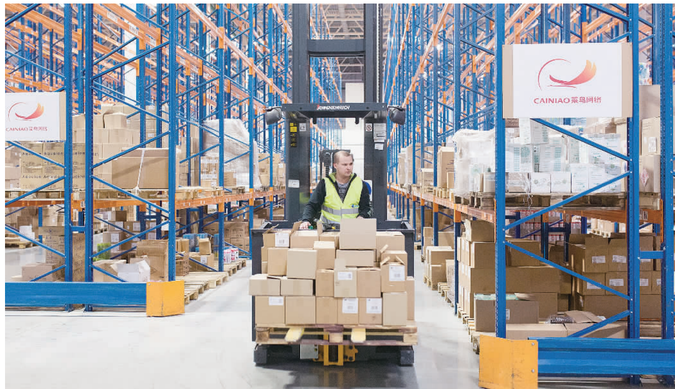
2016年一季度,俄罗斯跨境电商消费近700亿卢布(约合11亿美元),其中近一半发生在中国电商平台。图为位于俄罗斯莫斯科东南部的一家中国跨境电商物流企业的海外仓,工作人员运送货物。

另据《雅加达邮报》报道,除中小企业、经济技术合作章节外,有关竞争政策章节的谈判已经取得重要进展,货物贸易、服务贸易、投资、知识产权和技术劳工的自由流动等其他议题的谈判仍在进行中。明年2月份,RCEP成员国代表将赴日本继续谈判进程。