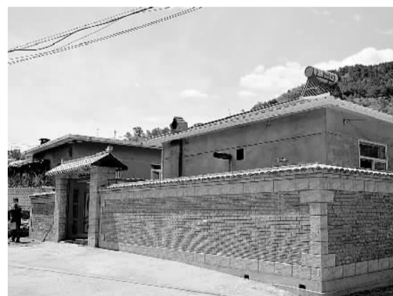
双滦区陈栅子乡河南营村民居改造示范户。