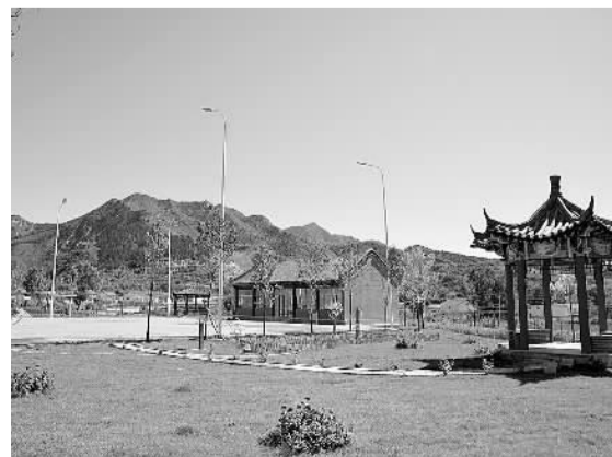
建成投入使用的双滦区大庙镇小三岔口村村史馆及活动广场。