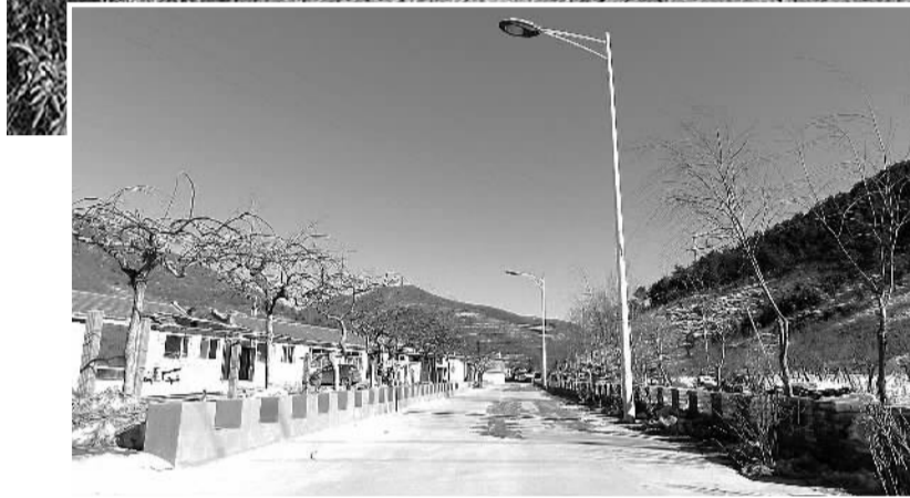
▲ 河北省承德市双滦区全景。

◀ 承德市双滦区大力推进美丽乡村建设，村容村貌发生了巨大变化，干净整洁的村庄街道，方便了村民出行，提升了文明村镇形象。