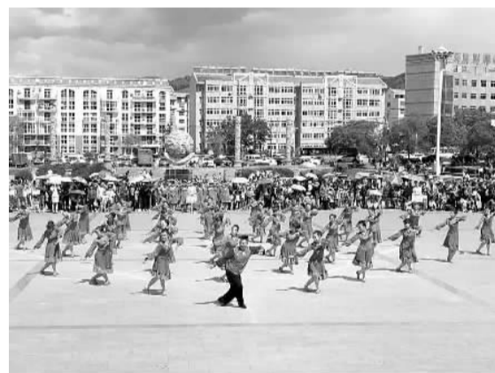
双滦区举办“美丽中国梦·幸福舞起来”第二届广场舞大赛，来自全区6个乡镇、3个街道的15支队伍，近600名队员参加比赛。大赛的成功举办活跃了基层文化生活，推动了文化惠民活动深入开展。