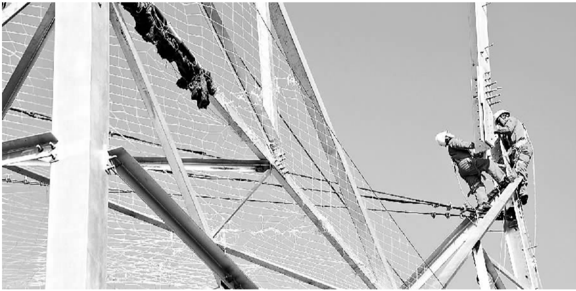
12月6日，昌吉—古泉±1100千伏特高压直流输电工程跨越秦岭段首基铁塔在陕西省商南县境内开始组立。该输电工程起点位于新疆昌吉，终点位于安徽宣城，途经新甘宁陕陕皖6省(区)，线路全长3324公里，工程造价407亿元，计划2018年建成投运。

当前，“标题党”乱象已严重影响了舆论生态的健康清明。该负责人指出，网上“标题党”乱象反映了当前互联网新闻信息服务中存在的突出问题，如网站对坚持正确舆论导向的重要性认识不足，自觉性不够；网站法制意识淡薄，履行主体责任不到位；网站过分追求点击量、过度追求标新立异、盲目攀比；网站管理制度不健全，内部编审制度执行不力；从业人员业务能力严重不足，相关专业培训欠缺等。