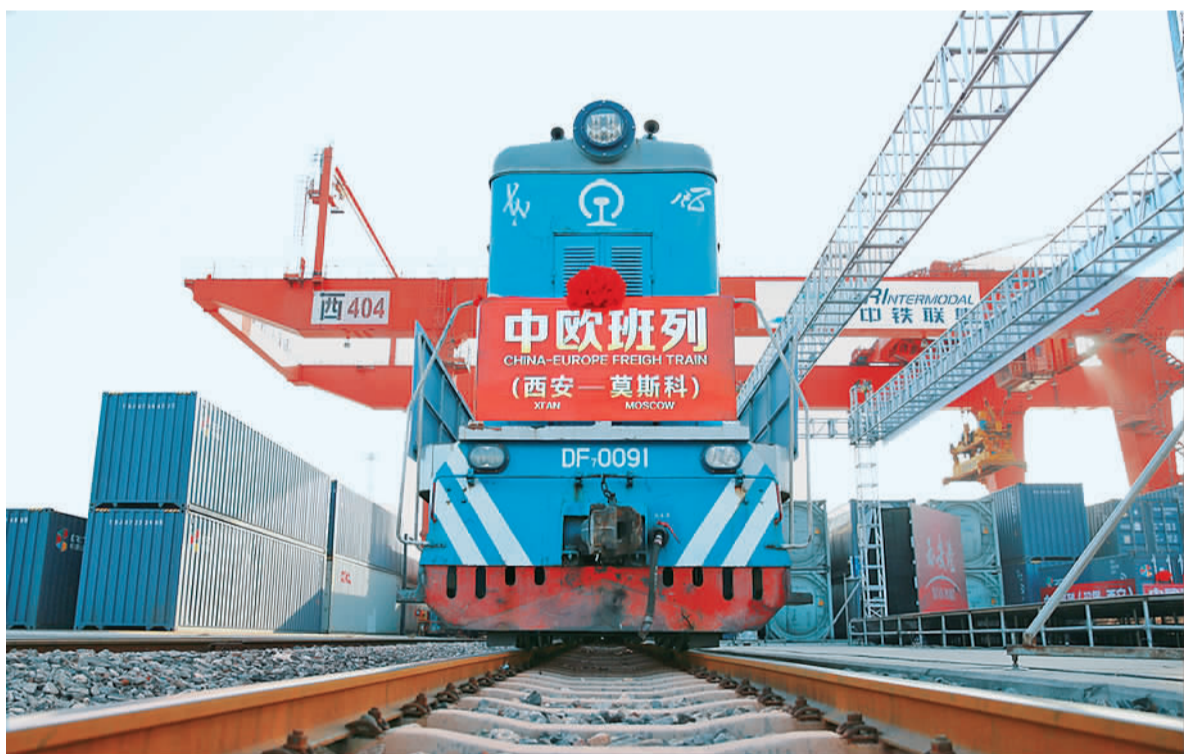
12月6日,随着机车一声长鸣,载有41个集装箱的国际货运班列缓缓驶出西安铁路局新筑车站,驶向7423公里以外的俄罗斯首都莫斯科。这是以西安为起点开行的第三条中欧班列运输线路。

根据《意见》安排,在加快基础设施互联互通建设方面,重点是畅通国际道路运输大通道,完善口岸枢纽集疏运体系,加大口岸基础设施建设力度。相关部门将围绕新亚欧大陆桥、中蒙俄、中国—中南半岛、中巴等重要经济走廊,畅通瓶颈路段,同时建成一批集产品加工、包装、运输、报关、报检等功能于一体的国际道路运输枢纽和物流园区。