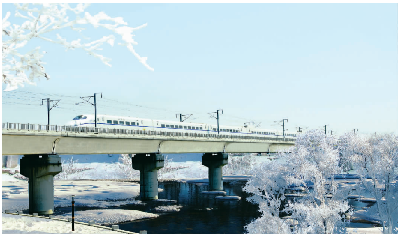
冬日里,高铁列车飞驰在哈大高铁线路上。

截至12月1日,哈尔滨至大连高速铁路开通运营4周年,安全发送旅客1.4亿人次,发送量逐年创新高。4年来,哈大高铁经受了雨雪冰冻、严寒低温、高温酷暑的洗礼,安全高效开行动车组列车262958列,沈阳铁路局实现了“把哈大高铁打造成高水平的高寒地区高速铁路”的目标。