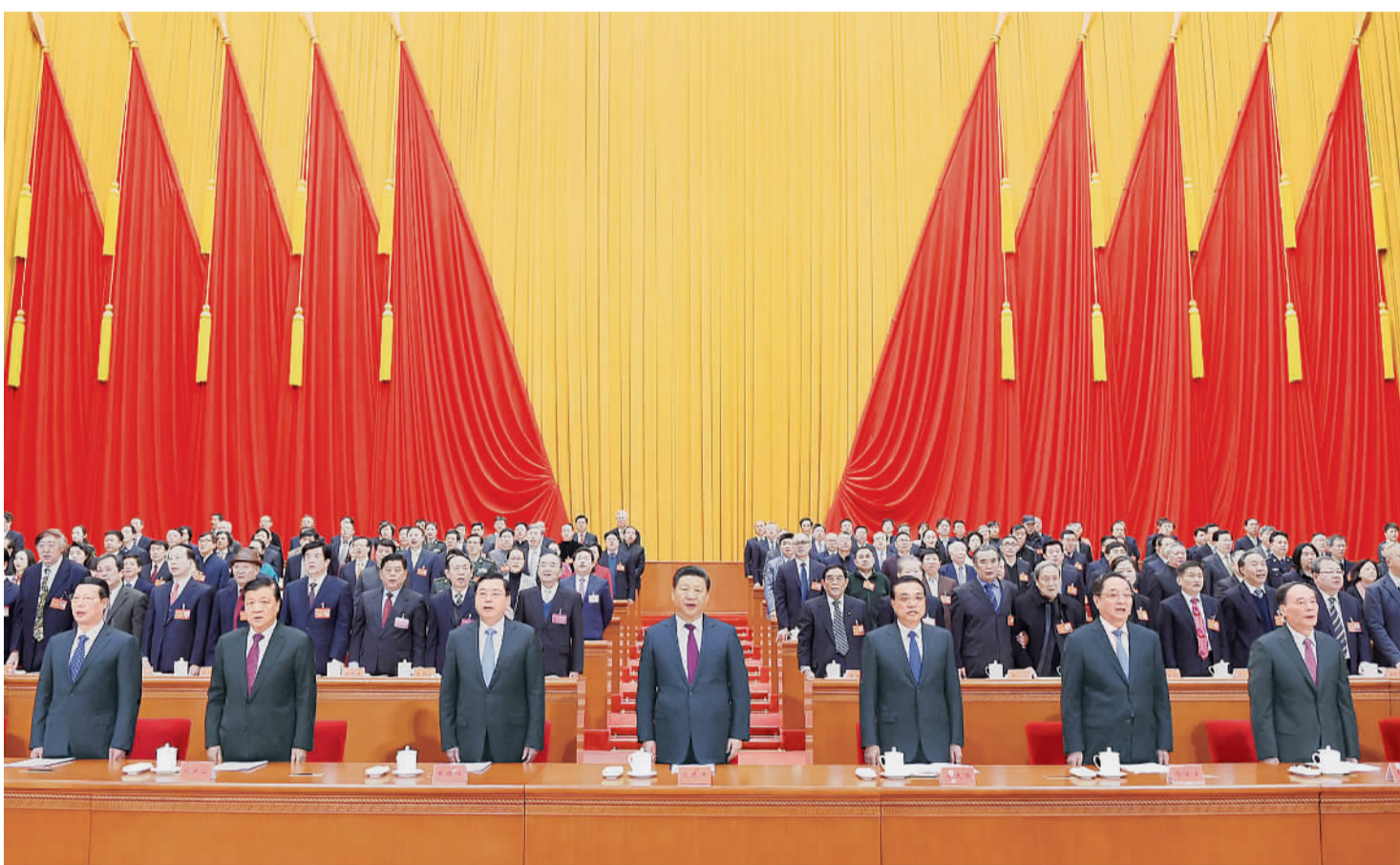
11月30日,中国文学艺术界联合会第十次全国代表大会、中国作家协会第九次全国代表大会在北京人民大会堂开幕。中共中央总书记、国家主席、中央军委主席习近平出席大会并发表重要讲话。