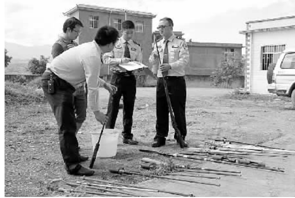
为全面收缴部分居民私藏的自制火药枪,消除辖区安全隐患,云南金平县公安局勐拉派出所创新“分类管控”工作法,民警深入村民家中开展一对一、一带一的说服教育工作,“缉枪爆爆”工作取得良好效果。

据了解,新修改的民事诉讼法将对个人的罚款最高金额由1万元提高至10万元,对单位的罚款最高金额由30万元提高至100万元。民事诉讼法还规定,对于违反诚信诉讼的单位,可以对其主要负责人或者直接责任人员予以罚款、拘留;构成犯罪的,依法追究刑事责任。2015年1月公布并实施的《最高人民法院关于适用〈中华人民共和国民事诉讼法〉的解释》规定,证人出庭作证应当签署诚信诉讼承诺书,签署诚信诉讼承诺书后作虚假证言,妨碍人民法院审理案件的,人民法院可以予以罚款、拘留,构成犯罪的,依法追究刑事责任。