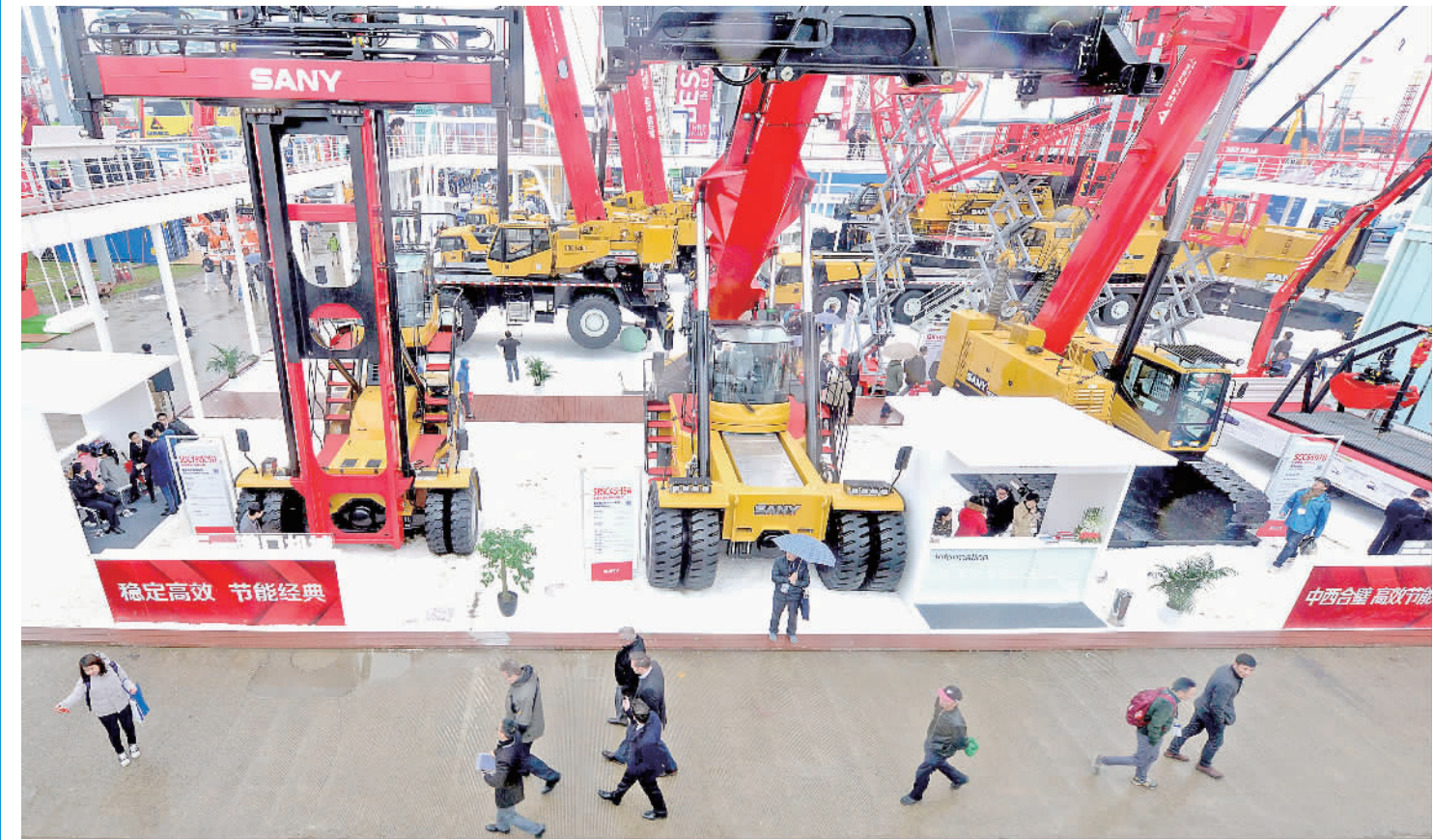
11月25日，为期4天的第八届中国国际工程机械、建材机械、工程车辆及设备博览会在上海新国际博览中心落下帷幕。作为中国及亚洲顶级的工程机械行业盛会，本届展会吸引了来自41个国家的2900多家企业参展，带来了工程机械及设备制造行业的最新产品、最新技术与智能制造创新成果以及最佳成套化解决方案。图为观众在展览现场参观工程机械系列产品展。

总统在入口处迎接，礼兵列队欢迎。机场离别时，科雷亚总统再赴机场，礼兵列队欢送。厄瓜多尔媒体一语双关：“习主席，欢迎您来到太阳的国度。” 秘鲁，如斑斓画卷，徐徐铺展。秘鲁作为亚太经合组织第二十四次领导人非正式会议东道主，库琴斯基总统日程繁忙。然而，78岁的他对此访几乎亲力亲为。清晨，习近平主席向独立先驱纪念碑献花圈，他破例陪同。总统府欢迎仪式前，他等候在广场。礼炮嘹亮，无数山鹰展翅，盘旋广场上空。 当习近平主席离开总统府时，库琴斯基总统走出大门亲自送别。离开秘鲁时，库琴斯基总统又打破既定安排，前来送行。习近平主席感慨，您给我们一个惊喜。 (下转第二版)