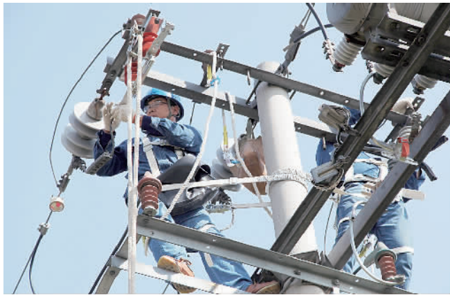
近日，山东大部分地区经历大幅降温过程。11月24日，国网山东昌邑市供电公司的施工人员冒着寒风对当地10千伏南庄线检修消缺，确保线路抗风、抗覆冰能力，为线路安全可靠运行，迎峰度冬保障民生打好基础。

近日，山东大部分地区经历大幅降温过程。11月24日，国网山东昌邑市供电公司的施工人员冒着寒风对当地10千伏南庄线检修消缺，确保线路抗风、抗覆冰能力，为线路安全可靠运行，迎峰度冬保障民生打好基础。