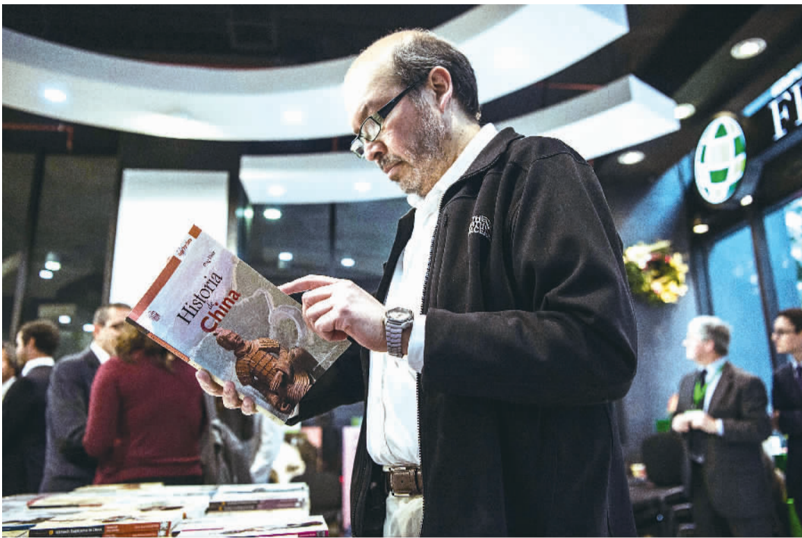
由国家新闻出版广电总局主办、中国图书进出口(集团)总公司承办的2016智利“中国主题图书展销月”活动23日在智利首都圣地亚哥开幕。图为一名参观者在“中国主题图书展销月”活动上读书。

联合国拉丁美洲和加勒比经济委员会执行秘书巴尔塞纳出席峰会并作主旨演讲。新华社社长蔡名照、墨西哥通讯社社长拉莫斯等20多位中拉媒体