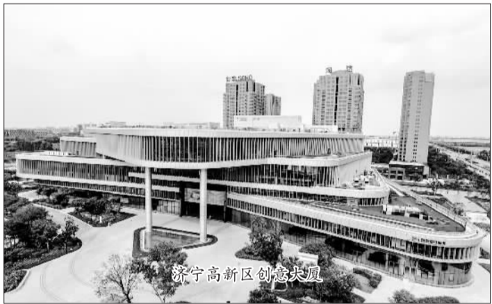
济宁高新区创意凤凰

如果把转型发展中的济宁经济比作一只振翅飞翔的大鹏,信息产业和绿色旅游俨然就是其矫健的双翼,引领济宁飞向更加高远的胜景。