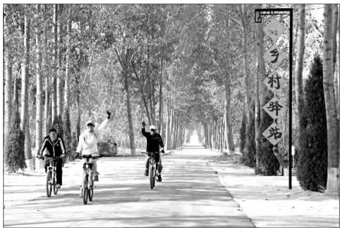
美丽乡村成为旅游新热点