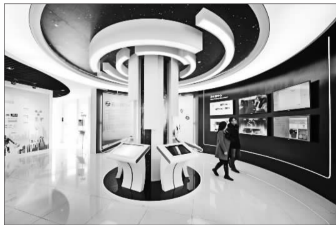
中科院计算技术研究所