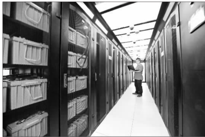
中兴通讯济宁智慧城市云数据中心