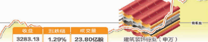
11月17日波动最大行业走势图