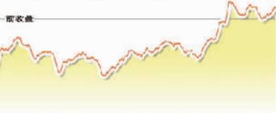
11月17日上证综指走势图