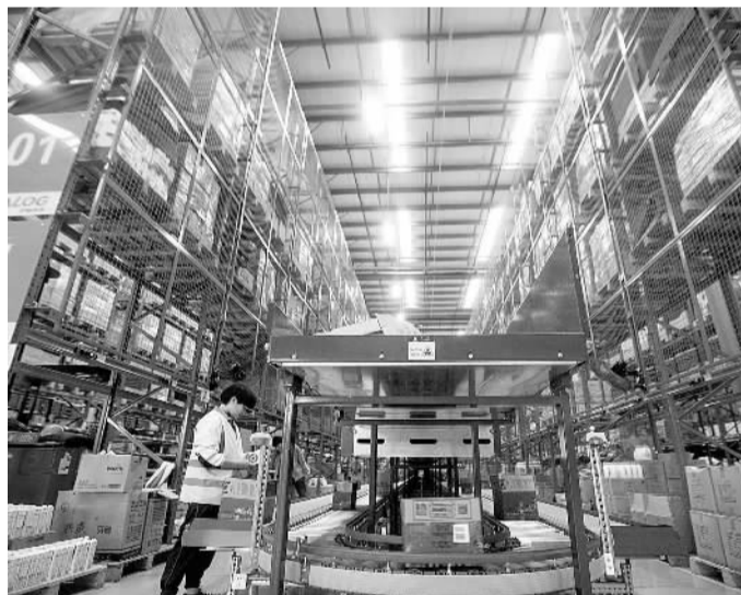
11月9日,一名工作人员在位于广州增城的阿里巴巴菜鸟网络全自动智慧仓储基地自动化轨道旁工作。

为确保落实“十三五”时期我国内贸流通发展的目标任务,《规划》还提出了7个方面的保障措施,主要包括健全管理体制机制、加大财政金融支持、调整优化税费政策、优化土地要素支撑、推进人才队伍建设、完善统计监测体系、落实规划推进机制等。