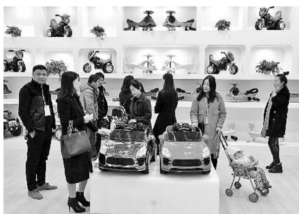
11月15日,坐落于河北平乡县的中国平乡世贸儿童玩具城项目正式投入运营,吸引了众多客商前来洽谈业务。目前,该商城是我国北方地区童车玩具行业最大的外贸出口基地和销售综合体。去年,平乡县童车产量为2300万辆,产值突破百亿元。

当前,化学学科和化工技术的研究方法和研究手段发生了重大变化,正在向更宽、更广、更深层延伸,一些颠覆性、革命性的重大突破成为可能。据李寿生介绍,跨国公司在今年至5年至10年的创新发展的重点,大都紧紧围绕生命科学、化工新材料、化工新能源、专用化学品和环保技术等领域,加速原始创新和特色创新。跨国公司在加快技术创新的同时,管理创新也在不断强化,他们通过精准的市场定位、超前的技术研发、严格的工艺管理、高效的工作效率和超强的盈利能力,开创了企业可持续发展的新优势。