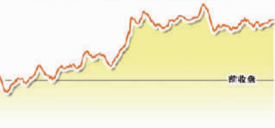
11月11日上证综指走势图