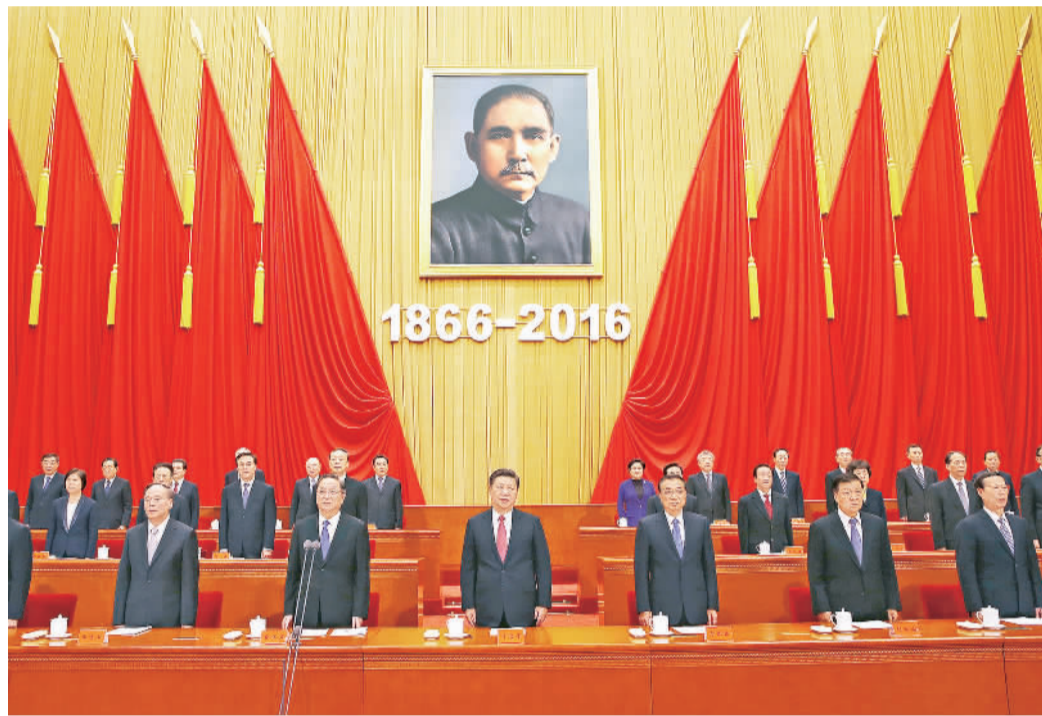
11月11日,纪念孙中山先生诞辰150周年大会在北京人民大会堂隆重举行。中共中央总书记、国家主席、中央军委主席习近平在大会上发表重要讲话。