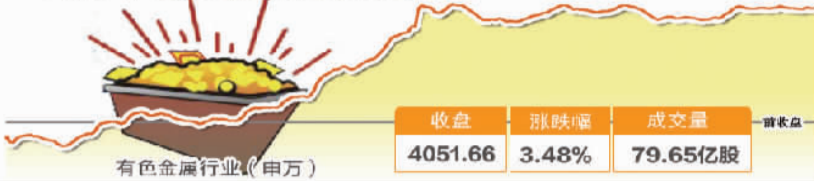
11月11日波动最大行业走势图