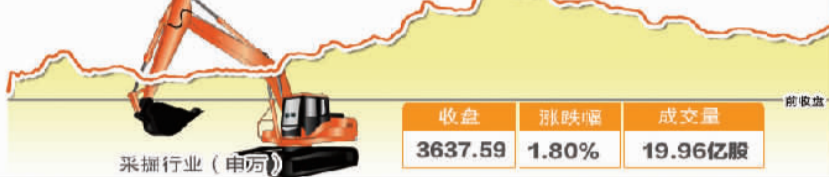
11月7日波动最大行业走势图

2020年我国分散式充电桩将超过480万个 《电力发展“十三五”规划》显示,2020年,我国将新增集中式充换电站超过1.2万座,分散式充电桩超过480万个,满足全国超过500万辆电动汽车充电需求。到2020年,实现北方大中型以上城市热电联产集中供热率达60%以上 (相关报道见第七版)