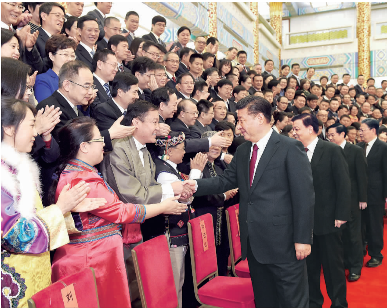
11月7日,党和国家领导人习近平、刘云山等在北京人民大会堂会见中华全国新闻工作者协会第九届理事会全体代表和中国新闻奖、长江韬奋奖获奖者代表。

习近平对广大新闻记者提出4点希望。一是要坚持正确政治方向,同党中央保持高度一致,坚持马克思主义新闻观,坚守党和人民立场,坚持中国特色社会主义,做政治坚定的新闻工作者。二是要坚持正确舆论导向,深入宣传党的理论和路线方针政策,深入宣传全国各族人民为实现“两个一百年”奋斗目标、实现中华民族伟大复兴中国梦进行的奋