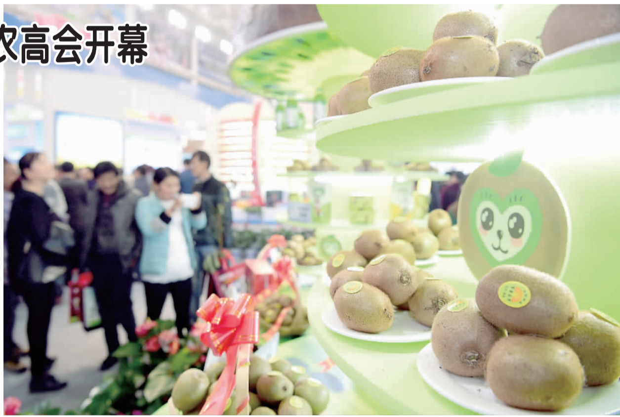
右图 这是杨凌农高会特色现代农业馆展示的猕猴桃。

本报陕西杨凌11月5日电 记者雷婷报道:第23届中国杨凌农业高新科技成果博览会今日在陕西杨凌开幕。本届农高会为期5天,以“落实发展新理念 加快农业现代化”为主题,吸引了来自国内16个省区市,以及境外50多个国家和地区共500多名政府官员、专家学者参会。 本届展会更加突出“一带一路”主题,邀请了35个“一带一路”沿线国家参会,占与会国家总数的70%;参会的丝路沿线国家政府官员、企业代表420人,占国外参展代表总数的81%。展会将发布最新农业科技成果、涉农专利1800多项,并遴选百名农业科技专家,开展为期4天的现场咨询活动。