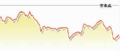
11月2日上证综指走势图