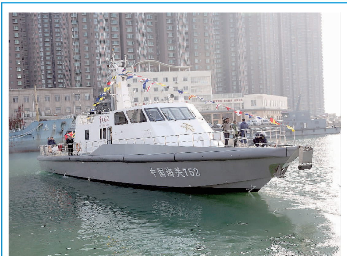
11月1日,山东青岛海关所属黄岛海关配备的监管艇“中国海关752”号在青岛港中港湾船坞海关浮桥码头正式启用,这是山东省内首艘海关监管艇,也是中国海关配备的首批监管艇之一。监管艇的投入使用将进一步丰富海关监管手段,提升海关对辖区海域的实际监管力度,增强海关对走私违规行为的威慑力。

新华社北京11月2日电 为了帮助广大党员、干部、群众深入学习贯彻党的十八届六中全会精神,中央有关部门组织编写了《〈关于新形势下党内政治生活的若干准则〉〈中国共产党党内监督条例〉辅导读本》、《党的十八届六中全会文件学习辅导百问》,对全会精神进行了全面阐释,是学习领会全会精神的权威辅导材料。书中收录了习近平总书记在党的十八届六中全会上所作的《关于〈关于新形势下党内政治生活的若干准则〉和〈中国共产党党内监督条例〉的说明》。近日,《〈关于新形势下党内政治生活的若干准则〉〈中国共产党党内监督条例〉辅导读本》由人民出版社出版发行,《党的十八届六中全会文件学习辅导百问》由党建读物出版社、学习出版社出版发行。