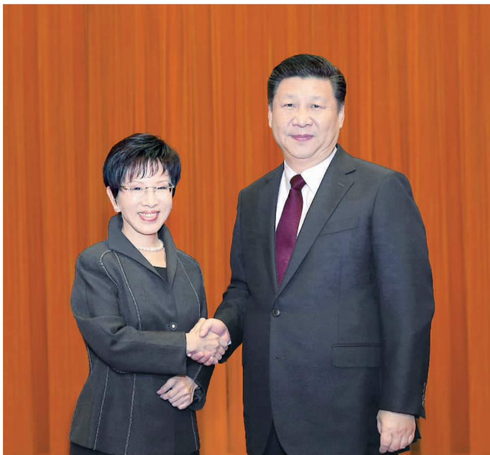
11月1日,中共中央总书记习近平在北京人民大会堂会见洪秀柱主席率领的中国国民党大陆访问团。

动。确保国家主权和领土完整是国家核心利益,是一条不可逾越的红线。中华儿女对近代以来国破山河碎、同胞遭蹂躏的悲惨历史有着刻骨铭心的记忆。捍卫国家主权和领土完整,绝不容忍国家分裂的历史悲剧重演,是全体中华儿女的坚定意志,是我们对历史和人民的庄严承诺。“台独”损害国家主权和领土完整,煽动两岸同胞敌意和对立,是台海和平稳定的最大