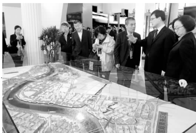
“世界城市日”在厦门的活动精彩纷呈，其中，2016上海国际城市与建筑博览会吸引诸多观众前来参观。