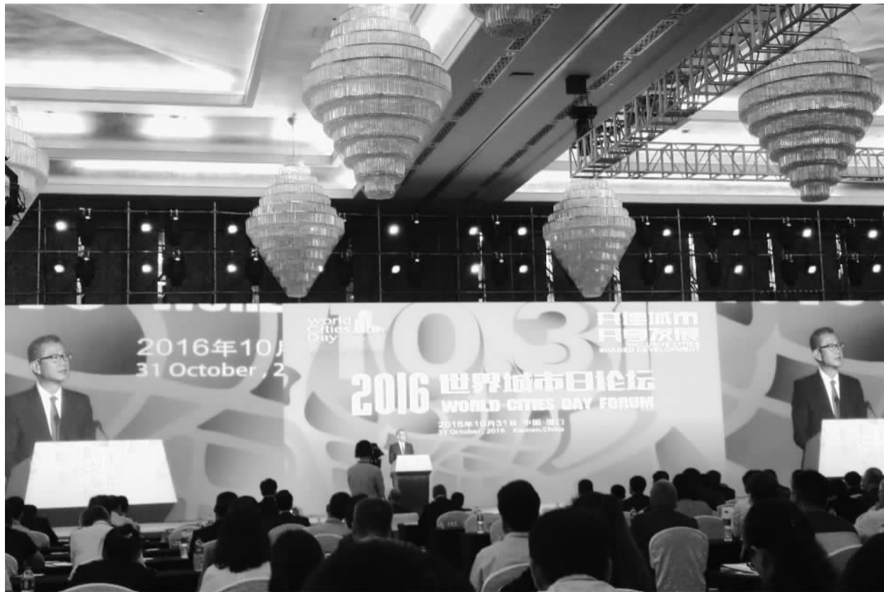
10月31日，“2016世界城市日论坛”在福建省厦门市举行。与会代表围绕“共建城市、共享发展”主题共论城市发展问题。

实现城市的共建，必须大力弘扬多元化、合作性的城市建设理念。积极发挥政府、公民、企业、社会组织等各方面的力量，