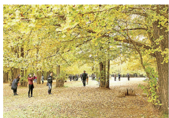
10月31日,游人在山东临沂市生园赏秋景拍照。深秋时节,当地银杏叶渐渐变成了醉人的金黄色,吸引了众多游客前来拍照留影。