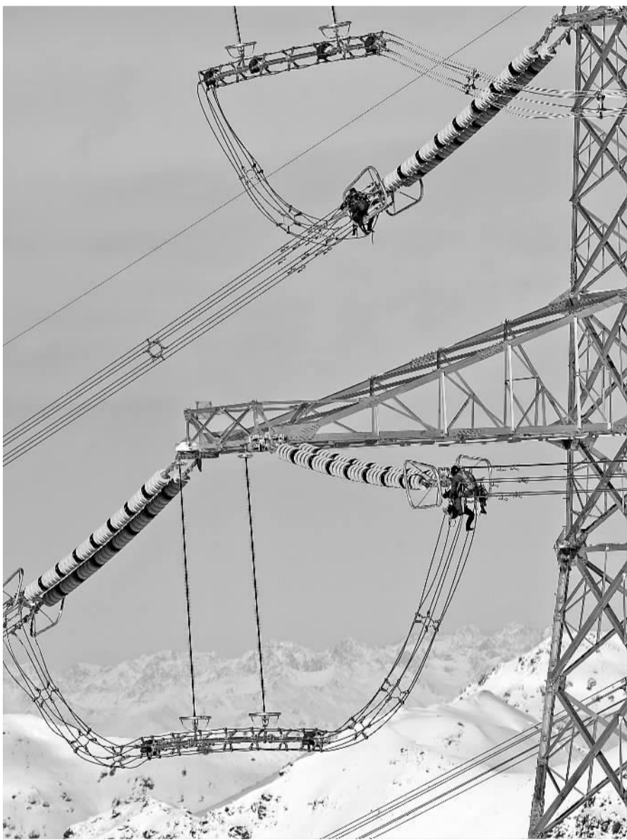
10月27日,电力工人冒着严寒在位于山巅的铁塔上进行投运前最后的检查工作。新疆伊犁一库车750千伏输电线路工程即将于11月初投运。这是我国750千伏输电线路首次跨越冰川和高山冻土区。工程的投运将首次形成新疆环天山西段750千伏大电网网架结构,实现南北疆电力互供、水电与光伏互补。

10月29日,广西边防总队北海支队石头埠边防派出所民警前往辖区码头,向渔、船民宣传安全防范知识。该支队派出所结合辖区码头内渔船聚集较多、安全事故隐患较大的实际,及时组织民警对码头进行走访,向渔、船民宣传安全防范的相关知识,告知渔、船民做好渔具等财产的保管及安全防护工作。