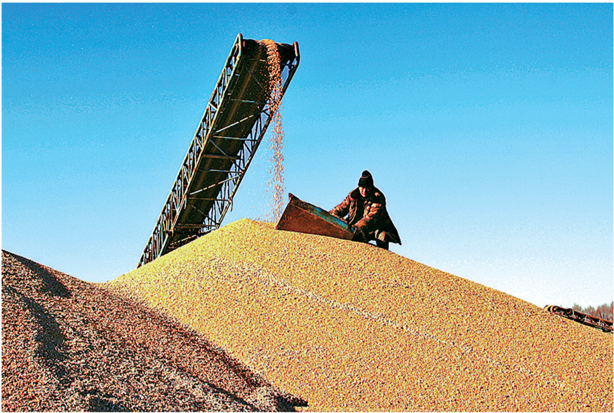
10月26日，黑龙江垦区建设农场第五管理区的晒场工人正在对前期收获的玉米进行烘干。据介绍，今年，该农场种植的玉米获得丰收，每日烘干玉米约300吨左右。