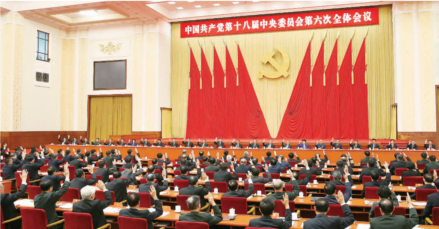
中国共产党第十八届中央委员会第六次全体会议,于2016年10月24日至27日在北京举行。中央政治局主持会议。