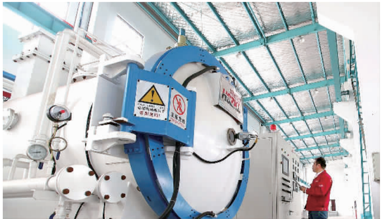
10月24日,安徽马鞍山市恒利达机械刀片有限公司新建成的马鞍山博望区集中热处理中心正在加工生产产品,该中心现已成为当地企业的公共服务平台。博望被称为全国刀具之乡,有1500余家相关企业。博望区实施工业“小巨人”培育计划,通过政府引导、政策帮扶、鼓励企业改造升级,做大做强一批具有核心竞争力的优势企业。

2016年是全面建成小康社会决胜阶段的开局之年,也是推进供给侧结构性改革的攻坚之年。前三季度经济运行情况显示,“去产能、去库存、去杠杆、降成本、补短板”五大重点任务取得积极进展,成效初显。