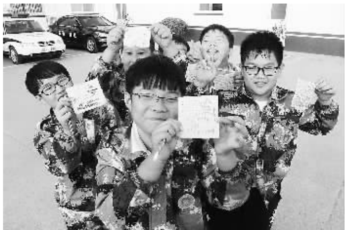
纪念红军长征胜利80周年之际,青岛边防支队阜康边防派出所联合即墨市青少年实践教育基地共同组织“我的长征,我的中国梦”主题教育活动。图为学生们展示写下的长征精神感悟。