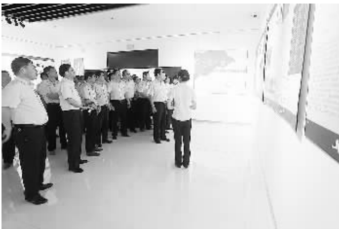
纪念红军长征胜利80周年之际,农行江苏宿迁分行组织党员干部前往当地博物馆参观先烈事迹及《天下为公——中国共产党的廉政建设》展览,感悟伟大长征精神,接受革命传统教育。

80周年大会上,对长征精神作了新的阐述。彪炳史册的“榜罗镇会议”,正式确定把中共中央和陕甘支队的落脚点放在陕北,“在陕北保卫和扩大苏区”。甘肃省通渭县榜罗镇党委书记李晨说:“榜罗镇是红军长征途中具有重大历史意义的地方,80年过去了,榜罗镇面貌虽然发生了很大变化,但还有贫困人口1.2万多人,脱贫攻坚是我们最大的任务。在推进脱贫攻坚的进程中,我们要继续大力弘扬红军长征精神,不怕苦、不怕累,引导群众转变观念,解放思想,主