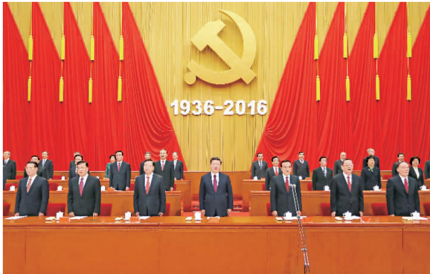
10月21日,纪念红军长征胜利80周年大会在北京人民大会堂隆重举行。中共中央总书记、国家主席、中央军委主席习近平在大会上发表重要讲话。