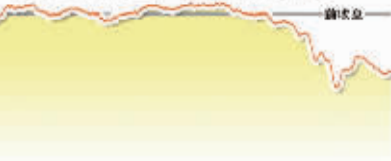
10月17日上证综指走势图