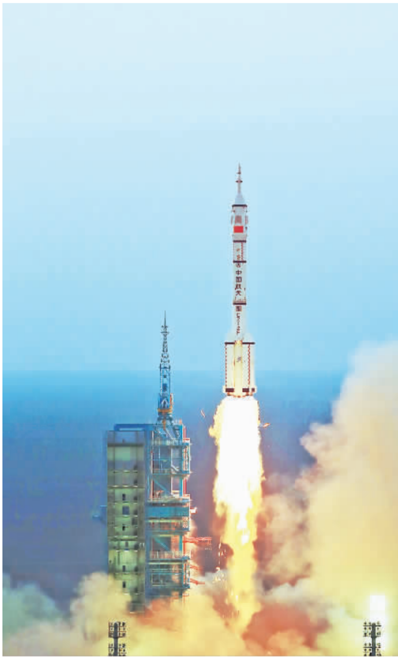
10月17日7时30分,搭载着神舟十一号载人飞船的长征二号F遥十一运载火箭在酒泉卫星发射中心点火升空。

按照计划,神舟十一号载人飞船在轨飞行期间将与天宫二号空间实验室交会对接。2名航天员将进驻天宫二号空间实验室,并开展科学实验和技术试验。目前,在轨运行30多天的天宫二号空间实验室已进入高度约393千米的近圆对接轨道,等待神舟十一号载人飞船对接。