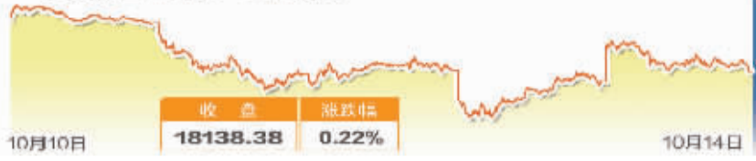
道琼斯工业指数一周走势图