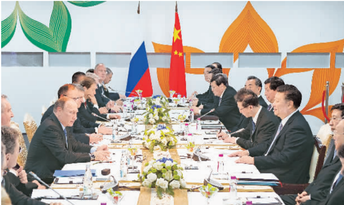
10月15日,国家主席习近平在印度果阿会见俄罗斯总统普京。