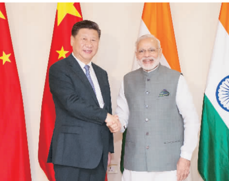
10月15日,国家主席习近平在印度果阿会见印度总理莫迪。