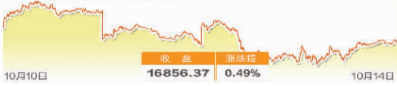
日经225指数一周走势图