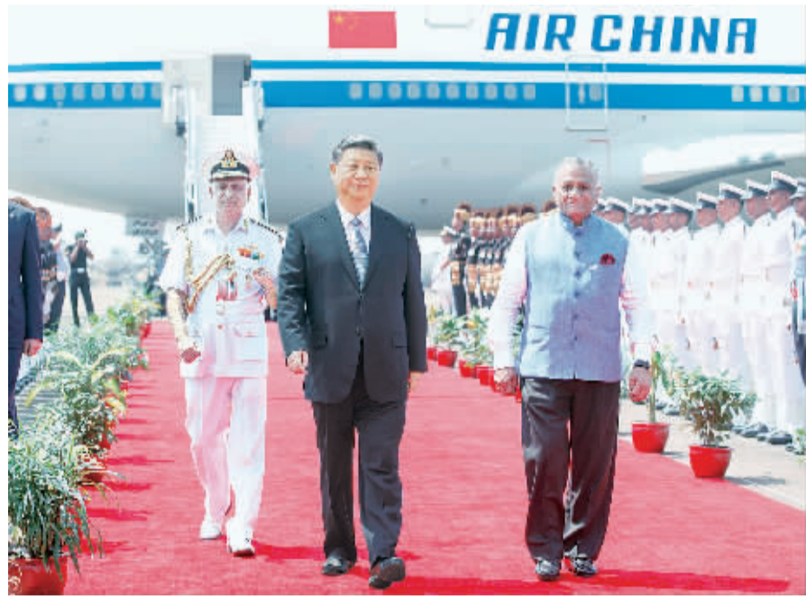
10月15日,国家主席习近平抵达印度果阿,应印度总理莫迪邀请,出席金砖国家领导人第八次会晤。

习近平指出,中方愿同印方一道,延续二十国集团领导人杭州峰会的积极势头,推动金砖国家领导人第八次会晤取得积极成果,对外传递信心、团结、合作的积极信号,深化务实合作,提升合作水平,加强在重大国际问题上的沟通和协调,维护共同利益。中方愿同包括印度在内金砖国家成员共同努力,办好明年第九次领导人会晤。