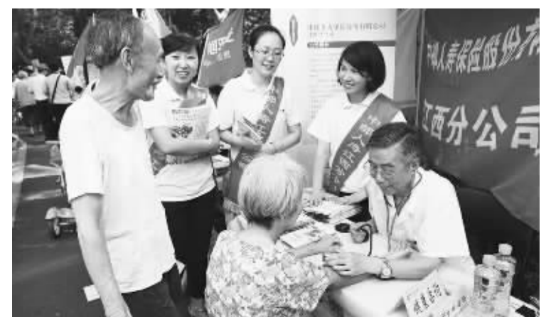
中邮保险为客户提供免费体检服务。今年是中邮保险成立第7个年头,7年来该公司秉承服务基层、服务“三农”理念,为群众提供方便快捷的金融保险服务。(资料图片)