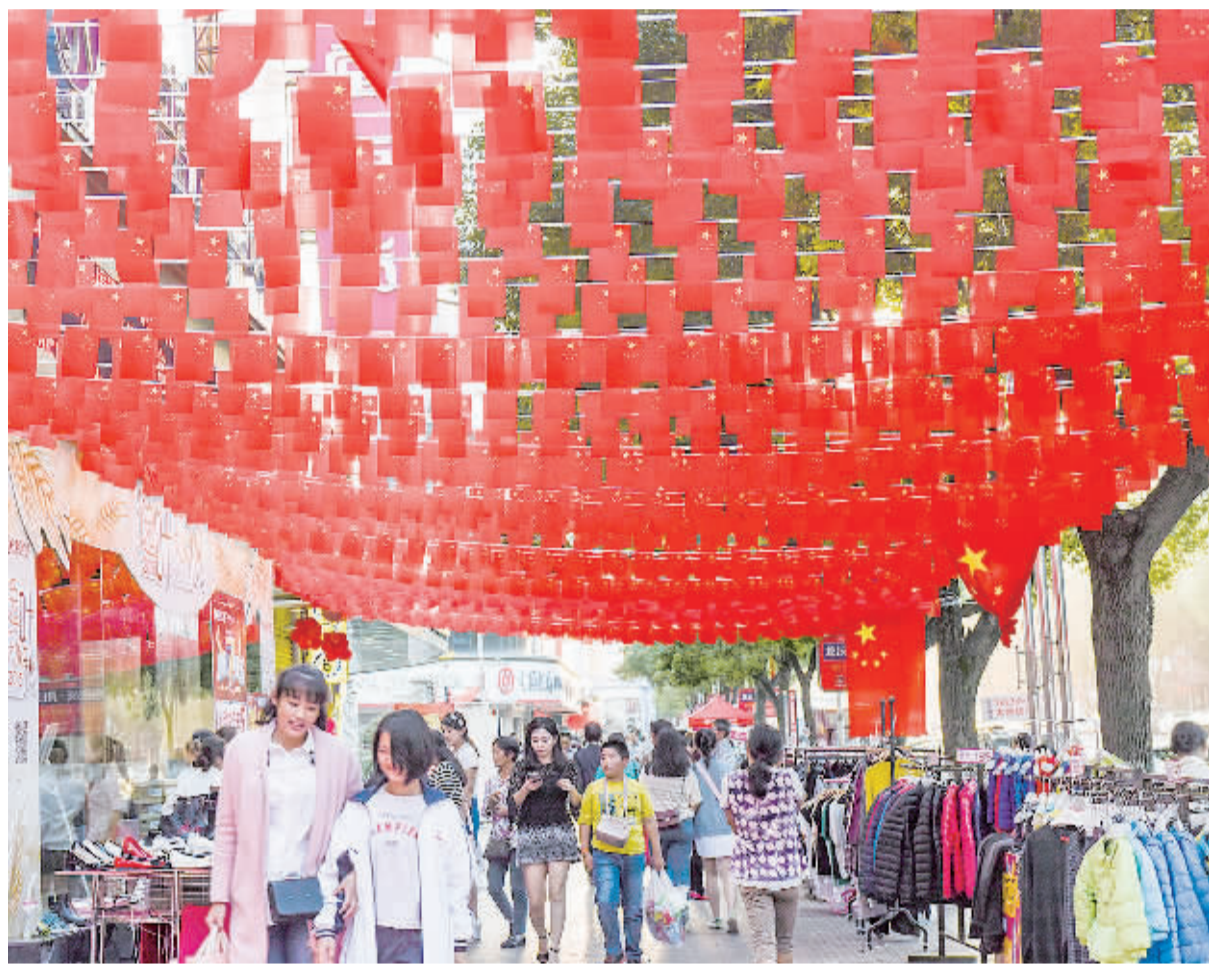
“十一”黄金周期间,全国各地精心组织购物节、美食节、特色商品展等形式多样的促销活动,有力活跃了节日气氛,繁荣了消费市场。应季服装、金银珠宝、家用电器、通讯器材、汽车等商品热销。图为节日期间的湖南沅陵县城街道,人们在逛街购物。

来自商务部监测数据显示,10月1日至7日,全国零售和餐饮企业实现销售额约1.2万亿元,比去年同期增长10.7%。商务部有关人士指出,今年“十一”黄金周,全国消费市场保持平稳较快增长,服装、家电、汽车等商品销售亮点突出,大众餐饮、旅游休闲、文体娱乐等服务消费备受青睐,绿色、共享、简约的消费理念深入人心,线上线下加快融合创新,个性化、多样化、定制化消费渐成趋势,人们越来越追求吃出健康、穿出时尚、玩出品质、玩出品位,呈现出多方面显著特征。