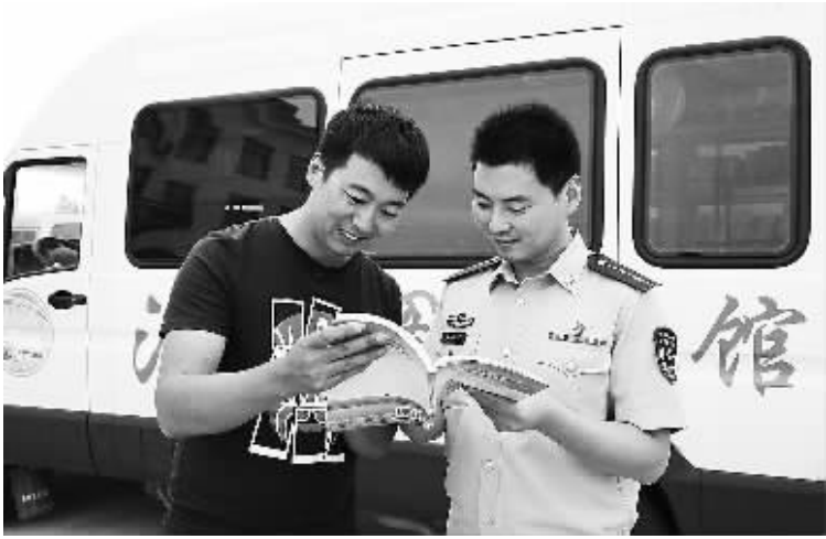
右图 10月4日，山东东营习口边防派出所的边防民警在流动图书馆浏览图书。为进一步推动军地共建工作，满足广大边防官兵的精神文化需求，国庆节期间，山东东营利津县文化馆设在当地边防派出所的流动图书室投入使用，为官兵提供学习娱乐的平台。