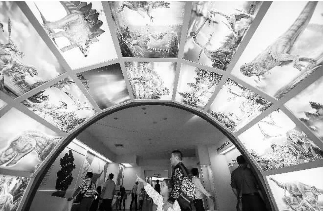
上图 10月4日，家长和小朋友在安徽省地质博物馆恐龙厅参观。当日是国庆假期的第四天，许多合肥市民选择前往安徽省地质博物馆参观，了解地球地质和生命的演变过程。