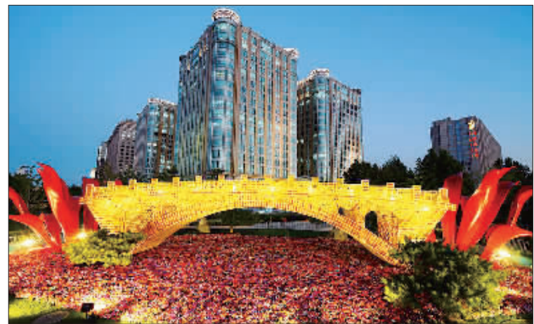
▶位于北京长安街沿线的国庆花坛“丝路金桥”，将“一带一路”沿线各国国花、市花融入由人工琥珀做成的金砖，璀璨夺目。