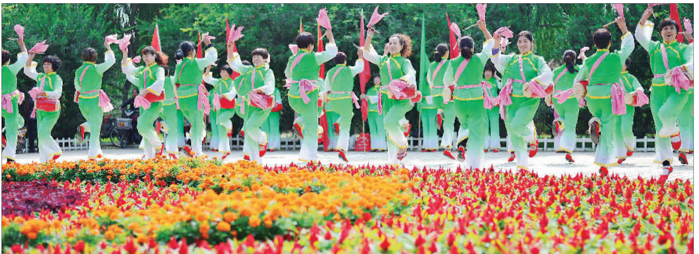
▲河北邢台县羊范镇农民舞蹈队打起腰鼓，扭起秧歌，庆祝新中国成立六十七周年。