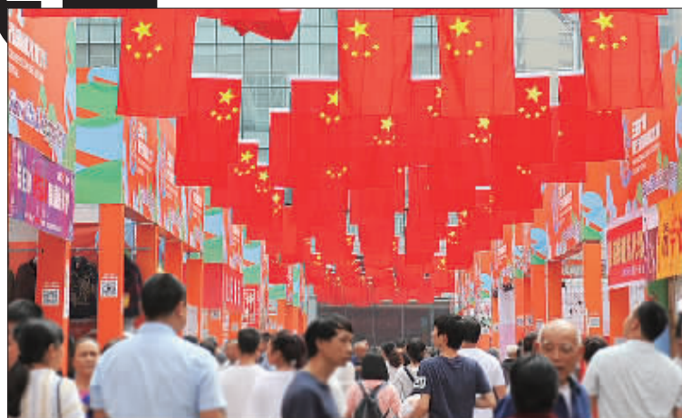
◀重庆市沙坪坝区三峡广场上百面五星红旗迎风飘扬。