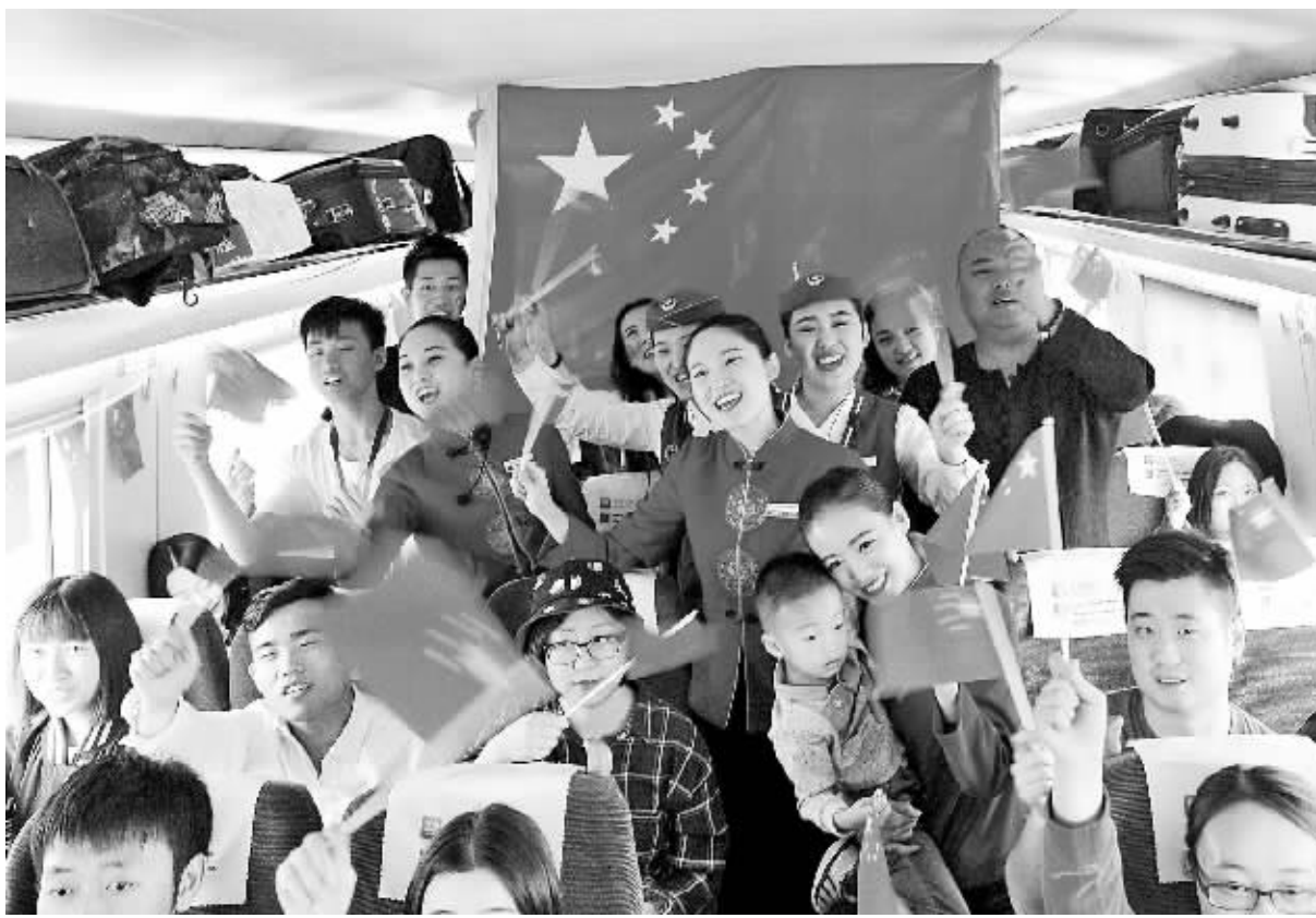
10月1日，北京南开往天津的C2031次高铁列车上，乘务员同旅客共唱《歌唱祖国》。当天是新中国67周年华诞，也是我国第一条高速铁路——京津城际列车开通运营的第八年。北京铁路局天津客运段在C2031次高铁列车上，开展祝福祖国“京津同欢为共和国庆生”旅客互动活动，与旅客共同表达祝福祖国的心声。

据了解，本届旅游节为期5天，还将在石景山游乐园、平谷金海湖和密云房车小镇设立分会场，部分优秀国外表演团队将为远郊区的百姓献上独具异域特色、精彩纷呈的演出，让北京国际旅游节成为山区百姓看世界的窗口。