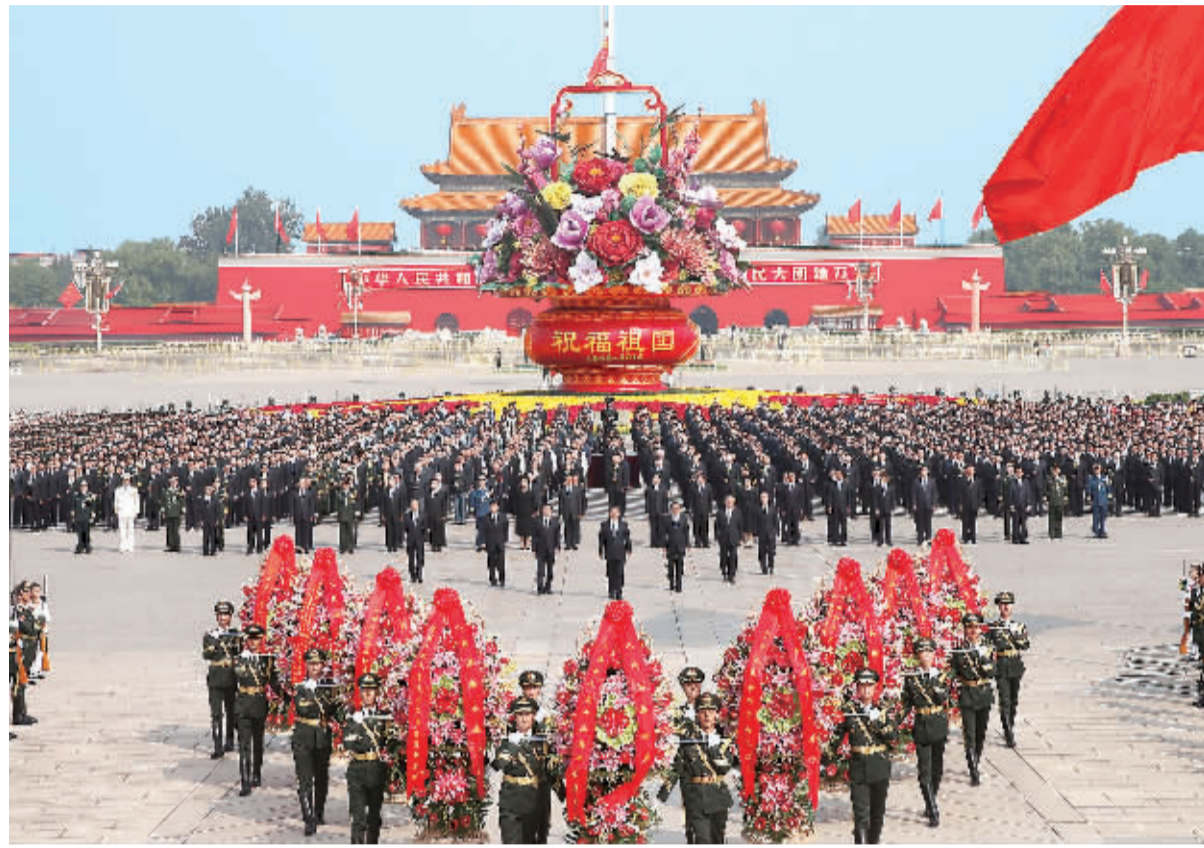
上图 9月30日上午,党和国家领导人习近平、李克强、张德江、俞正声、刘云山、王岐山、张高丽等来到北京天安门广场,出席烈士纪念日向人民英雄敬献花篮仪式。