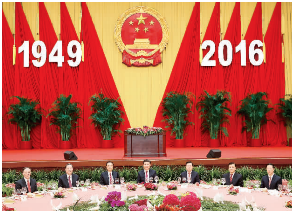
9月30日晚,国务院在北京人民大会堂举行国庆招待会,热烈庆祝中华人民共和国成立六十七周年。习近平、李克强、张德江、俞正声、刘云山、王岐山、张高丽等党和国家领导人与中外人士欢聚一堂,共庆共和国华诞。

老战士、老同志和烈士亲属,中国少年先锋队名义敬献的9个大型花篮一字排开,花篮红色缎带上写着“人民英雄永垂不朽”8个金色大字。 军乐团奏响深情的《献花曲》,18名礼兵伴着乐声抬起花篮,缓步走向人民英雄纪念碑,摆放在纪念碑基座上。 习近平等党和国家领导人随后登上纪念碑基座,在花篮前驻足凝视。明黄的文心兰、火红的玫瑰、鲜艳的红掌、芬芳的百合……寄托着深深的思念,承载着美好的祝福。 习近平走上前,仔细整理花篮缎带。接着,习近平等党和国家领导人缓步绕行,瞻仰人民英雄纪念碑。 党的十八大以来,全国各族人民在以习近平同志为总书记的党中央领导下,不忘初心、继续前进,坚定不移走中国特色社会主义道路,统筹推进“五位一体”总体布局,协调推进“四个全面”战略布局,为实现“两个一