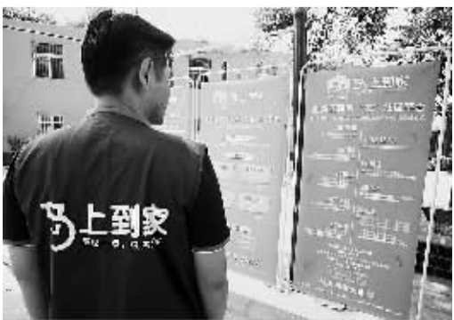
智慧社区建设为各类组织、公众搭建舞台。