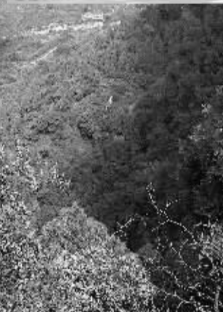
△ 西安市临潼区通过实施骊山北麓植被恢复工程，将昔日荒山变成了城市森林公园。

学几百名同学正在操场上活动。操场边，一大片小柳树正舒展着绿叶。这些柳树都是最近几年毕业生亲手种下的，树上挂着的小牌子记录着植树人。“同学们离校前都要种下小树，给母校留个纪念。”该校副校长张俊华说。