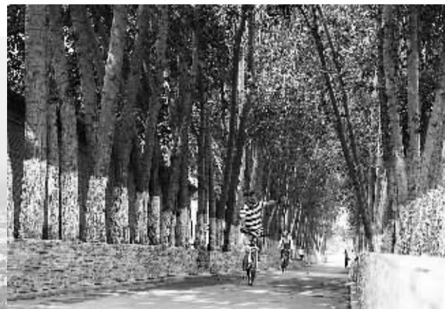
△ 两位市民在北京大运河森林公园骑行。该园栽种了40余万株树木，是北京城市副中心的天然氧吧。