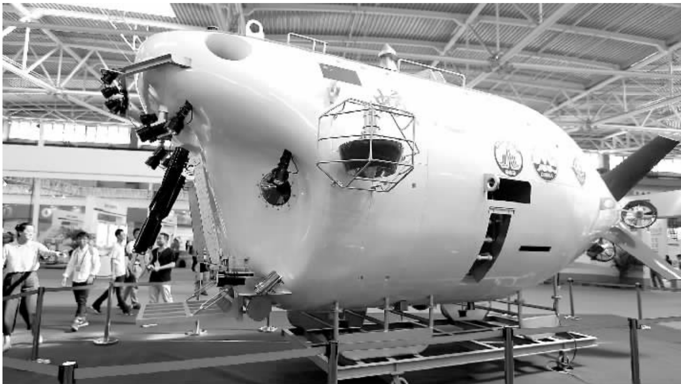
9月26日,2016中国(青岛)国际海洋科技展览会在山东即墨市青岛国际博览中心开幕,500多家海洋科技领域知名科研院所、高校和涉海企业参展。近年来,海洋经济话题越来越热,相关主题活动也越来越频繁。

当前,中国海洋产业结构调整步伐正在加快,高技术产业化进程加速,产业结构进一步优化,发展形态更加多元,已步入良性、快速发展轨道。但也应看到,海洋经济发展中不平衡、不协调和不可持续的问题依然突出,结构调整、创新发展的任务依然繁重——