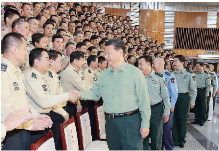
9月26日,中共中央总书记、国家主席、中央军委主席习近平视察火箭军机关,代表党中央和中央军委,对火箭军第一次党代表大会的召开表示热烈的祝贺,向火箭军全体指战员致以诚挚的问候。这是习近平亲切接见火箭军第一次党代会全体代表。

习近平强调,要在提升战略遏制能力上实现新突破,贯彻新形势下军事战略方针和军队建设发展“十三五”规划纲要总体部署,制定火箭军发展战略和规划建设规划计划,把火箭军力量结构和部队