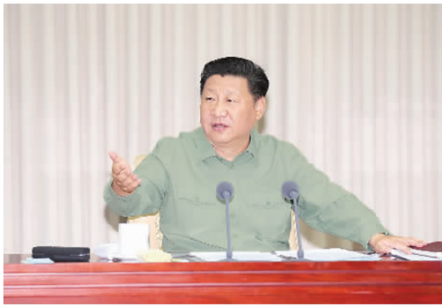
9月26日,中共中央总书记、国家主席、中央军委主席习近平视察火箭军机关,代表党中央和中央军委,对火箭军第一次党代表大会的召开表示热烈的祝贺,向火箭军全体指战员致以诚挚的问候。这是习近平听取火箭军工作汇报后发表重要讲话。