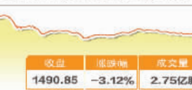
9月26日波动最大行业走势图