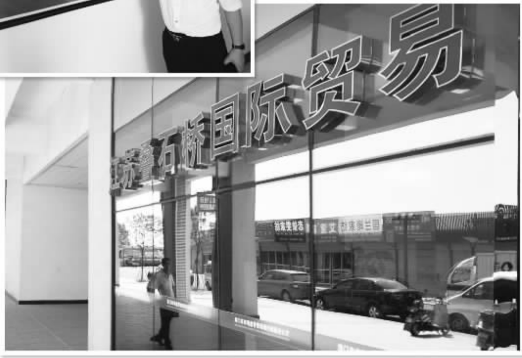
下图 叠石桥家纺市场专门设立了国际贸易服务中心,为客商提供便利化通关服务。

当很多商家还在抱怨外贸不好做的时候,江苏海门叠石桥家纺市场的出口却逆势上扬。1年来,这个本以内贸消费为主的传统家纺市场,迸发出令人难以置信的活力,让我们的调研不断充满惊喜,同时也深深感受到贸易改革释放的巨大市场力量。