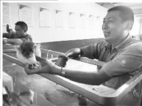
下图 在江苏南通龙洋水产有限公司养殖车间,工作人员向记者展示人工养殖的河豚。