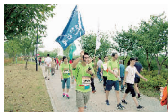
9月18日,农业银行苏州姑苏支行开展“环古城步道 普金融知识”主题活动,在苏州环古城河步道以环保健康的健步走形式开展金融知识宣传,以趣味十足的形式带动市民学习金融知识的积极性。