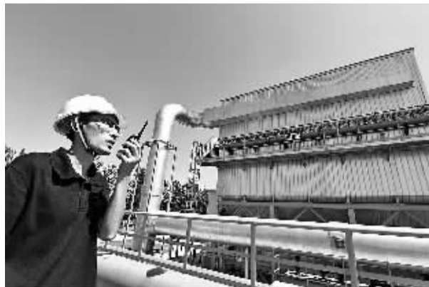
技术人员在对窑炉废气净化处理设备运行巡检。近日,投资1800万元的国内首套窑炉废气净化处理设备在河北廊坊开发区利比玻璃制品(中国)有限公司投入使用。