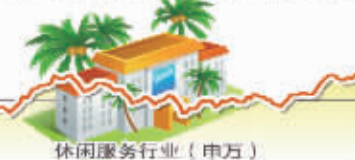
9月9日波动最大行业走势图