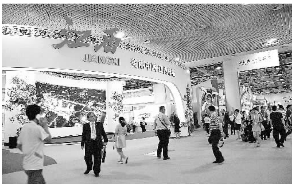
江西省是第十九届中国国际投资贸易洽谈会的“主宾省”，除设立1000平方米主题展区，还将举办一系列投资促进活动。全方位展示江西良好的风土人情和投资政策，强力促进招商引资。