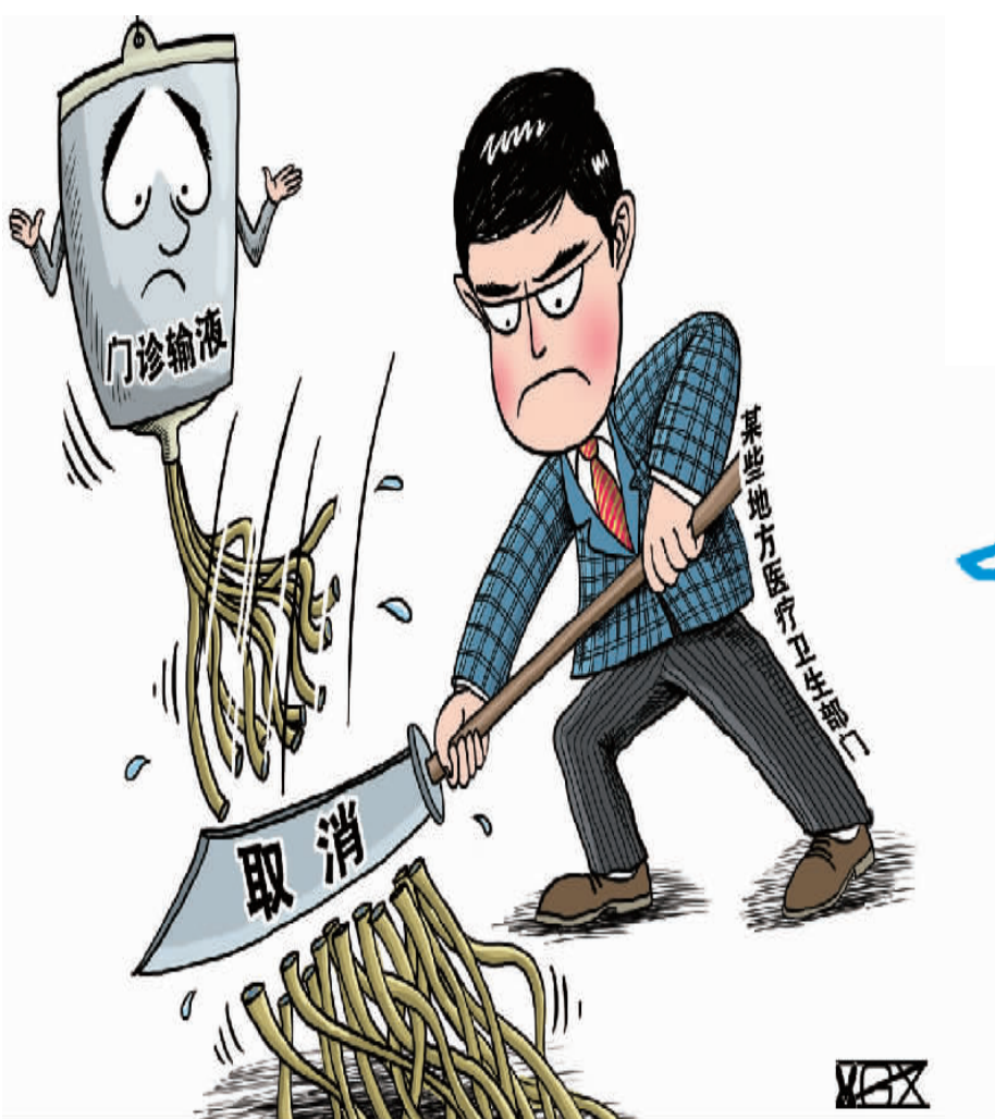
翟桂彦作 (新华社发)

因此,当下最重要的,是摸清楼市供给侧和需求侧的真实状况,既摸清现有存量、供应量的结构状况,也摸清城镇居民目前的住房情况,把结构性矛盾搞清楚。鉴于在住房商品化过程中,所有交易已经电子化,供给侧的调查不妨以房屋管理部门的网签数据、房产证发放资料和统计部门的房地产开发统计数据为依据,辅以必要的现场核实和补充调查。而对需求侧的调查,可以结合公安部门的人口资料,统计部门去年刚刚进行的1%人口抽样调查进行。摸清楼市现实状况虽然费时费力,但这项工作做好了,必然有利于楼市调控看清方向、减少争议、避免反复,因城施策也才能收到应有效果。